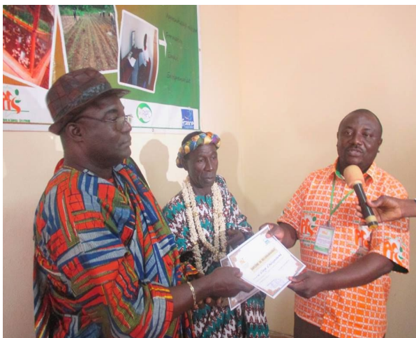
La chéferie traditionnelle reçoit une distinction