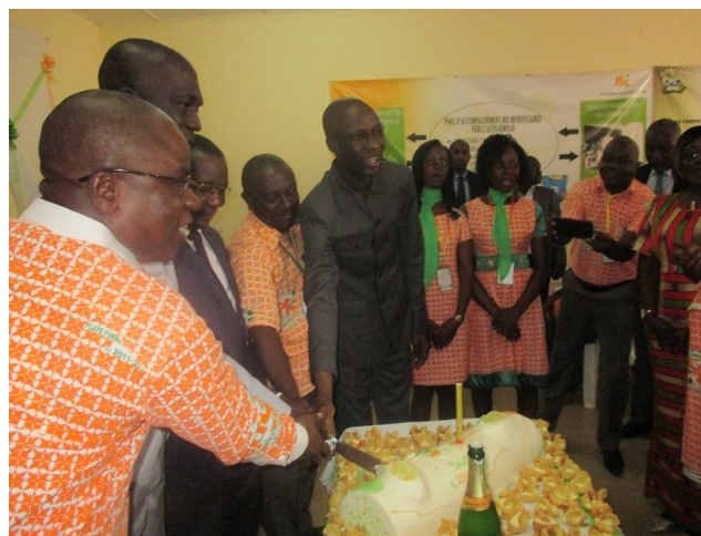
La coupure du gâteau