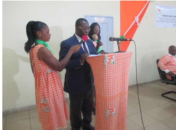
Le Secrétaire Exécutif de la PFS-CI