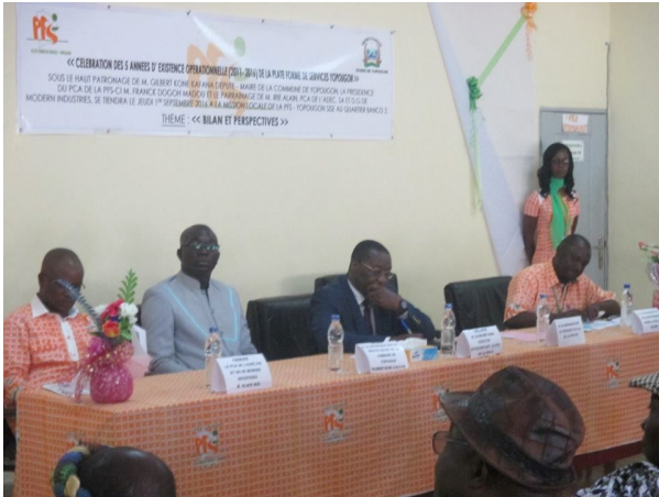
La table de séance